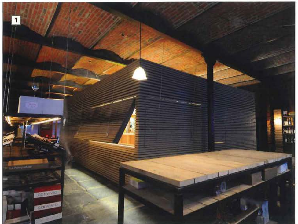
Dans une ancienne filature, Meunier et Westrade ont intégré un restaurant, un magasin de vins et un bar. Pour ce projet 'boîte', on a travaillé avec un budget très serré

Même avec un minimum de moyens, ils créent des concepts qui surprennent et étonnent.